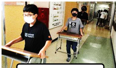
早速机運びで活躍する6年生

「2個のスイカをカットスイカにしてたくさん食べたよ！」 「田舎のおじいちゃんのうちに行ってきました。いろんな虫を捕まえたよ。」「松島に行ってきた。少し深いところもあったけど海に入ることができたよ。」など、子供たちの言葉と表情には夏休みの満ち足りた思いがあふれていました。感染症による制約があったとは思いますが、それぞれが夏休みだからこそその貴重な経験や学習ができたのではないかと思います。